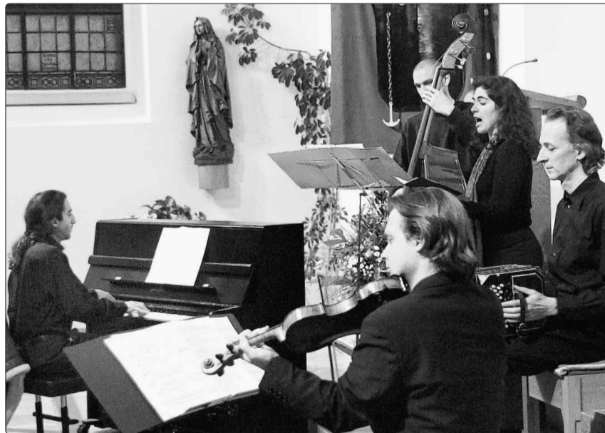
Das Ensemble «insieme» verbreitete mit seinem Tango eine feurige Atmosphäre in der katholischen Kirche.

Das Ensemble «insieme» spielte vorwiegend Werke von Astor Piazzolla, dem Gründer des «Tango nuevo». Dieser bereiste die ganze Welt, studierte in Paris moderne Komposition, kam in New York mit dem Jazz in Kontakt und vereinte diese Ele-